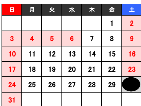
2026 5 May